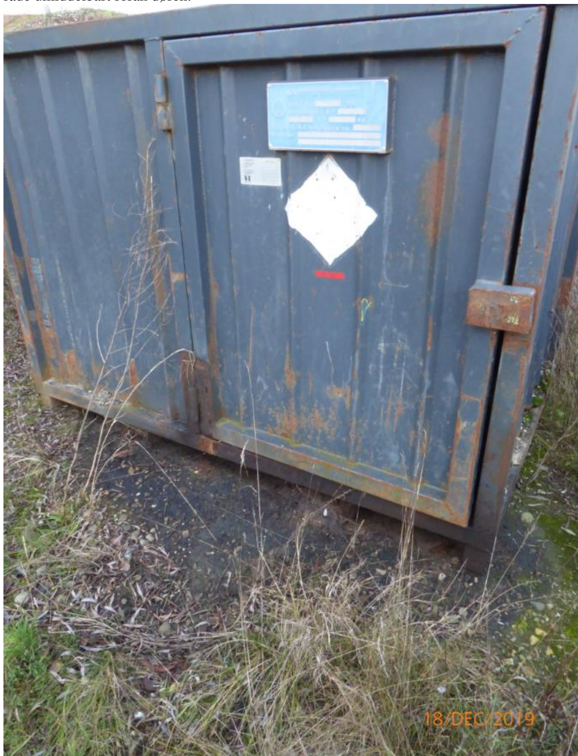
FOTO 7. Mobiltank A med tydelig sortfarvning af terrænoverfladen ud for containerens dør. Jordprøver udtaget ved blanding af 5 nedstik i dybden 0 – 10 cm under terræn i misfarvet område umiddelbart foran døren.