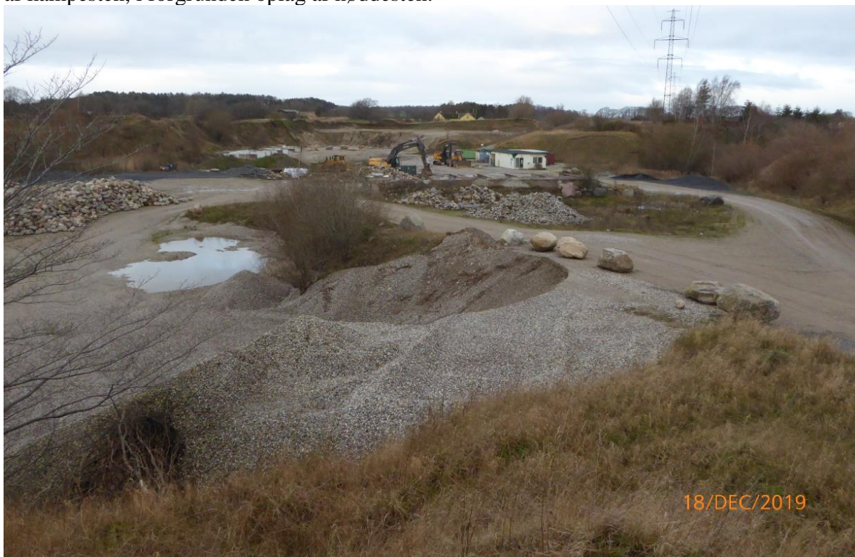
FOTO 2. Oplagsplads set mod nordvest, fra rampen og ned i graven. Midt i billedet ses mindre oplag af kampesten. Rød cirkel angiver placering af tank A og B.

FOTO 1 Oplagsplads set fra rampen (i forgrunden) og mod nord. Mod vest (venstre) ses oplag af kampesten, i forgrunden oplag af nøddesten.